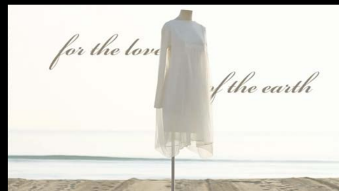
CLIENTE EUROPEAN CULTURE