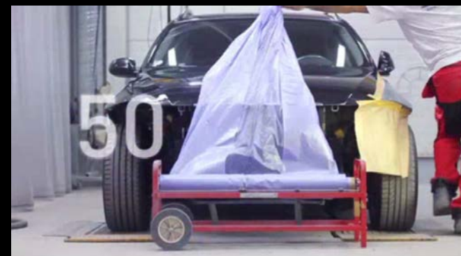
CLIENTE SPIES HECKER