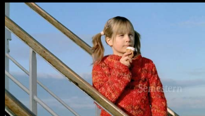
CLIENTE STENA LINE